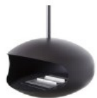
Zwevende vuurbal Hanghaard, Cocoon Fires via Haardcentra.nl, 2437 euro