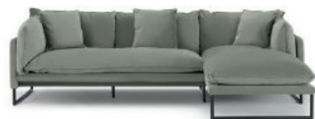
Salie, sereniteit, sofa Hoekzetel, Made, 2.099 euro

Een minimalistisch interieur kil? Mis. De juiste kleuren en materialen brengen warmte naar een woonkamer of keuken waar strakke lijnen regeren. Kies voor houtwerk of natuursteen en combineer met zachte texturen. (mk)